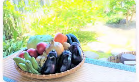
泉州の古民家スタッフが目利きした季節の野菜はいかが？