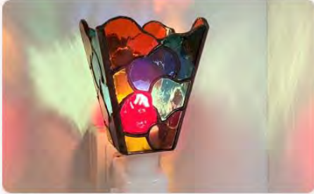
カラフルなハートの光が寝室を優しく照らす、匠のステンドグラス