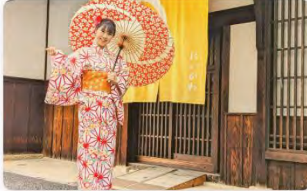
5分で簡単に着られる着物&レトロな町並みで思い出をバシヤリ！